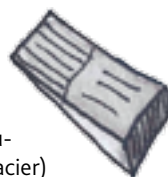
Un billot de bois bien large, lourd et stable.

Un coin. Il s'agit d'une pièce triangulaire (en fer ou en acier) qui est utilisée pour faciliter le fendage, notamment lorsque les rondins sont très gros ou lorsque le bois présente des nœuds.